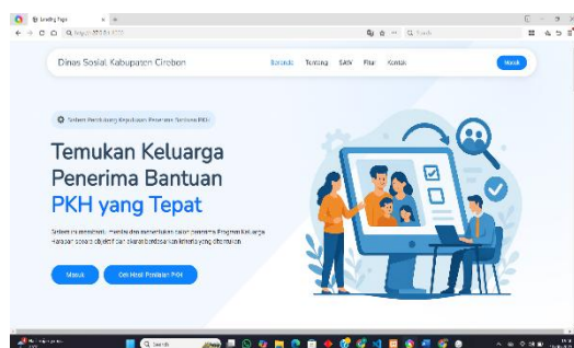
Gambar 1 Halaman Landing Page

proses seleksi penerima bantuan PKH secara terintegrasi. Implementasi sistem mencakup beberapa fitur utama, yaitu pengelolaan data kriteria, subkriteria, alternatif, serta proses penilaian dan perhitungan menggunakan metode Simple Additive Weighting (SAW). Halaman antarmuka seperti landing page , login, dashboard , serta pengelolaan data (kriteria, subkriteria, alternatif dan penilaian) berfungsi sebagai media interaksi pengguna dalam menginput dan mengelola data. Selain itu, halaman perhitungan SAW menampilkan proses pengolahan data secara transparan, mulai dari nilai awal, normalisasi, hingga hasil akhir perankingan ditunjukkan pada Gambar 2 dan 3.